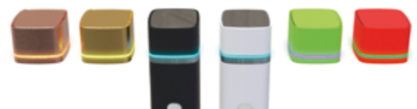
Opzioni multiple di rifinitura cromatiche